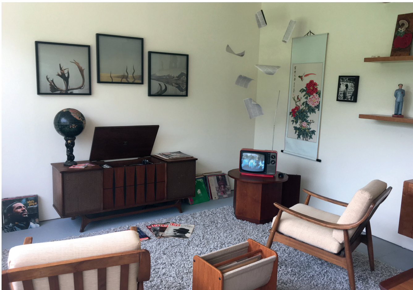
卡丽·梅·威姆斯，《Heave》展厅现场（个案研究一角），2018

件物品，包括杂志、挂画、电视录像、电脑游戏等，都象征着来自个人选择的暴力思想。与“客厅”截然不同的展厅二是一间放映室，循环播放充斥着家庭暴力、政治动荡、种族仇恨和杀戮等元素的由新闻片段与自摄素材剪成的短片。如果说威姆斯的作品以女性视野观测种族问题在性别歧视等社会冲突上的衍生，那么惠特森的行为艺术《A Meditation on Tongues》则是站在酷儿（Queer）群体的角度上对话题的补充：在这场根据马龙·里格斯的1989年视频改编的表演里，有色人种与同性恋者作为“身体非常规者”，通过肢体语言与编舞来撞击人群感官以引起主流对该社会问题的关注。