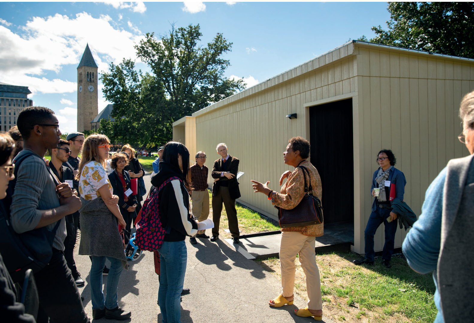
康奈尔艺术双年展特邀艺术家卡丽·梅·威姆斯（右三）正在与观众讨论她的装置作品《Heave》