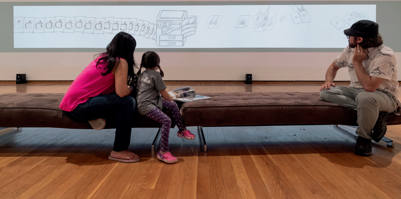
《文字的性格》在康奈尔艺术双年展2018里的陈列一角